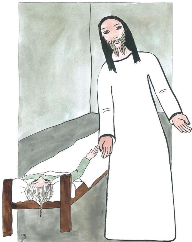
5. neděle v mezidobí cyklu B Mk 1,29-39