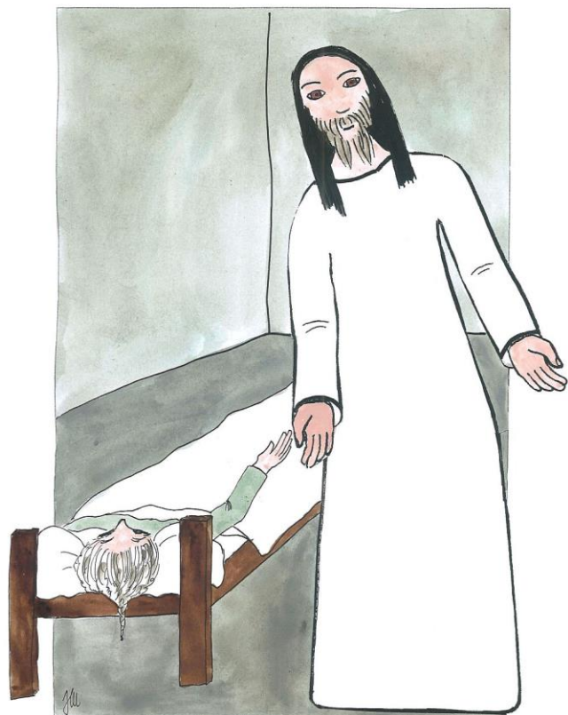
5. neděle v mezidobí cyklu B Mk 1,29-39