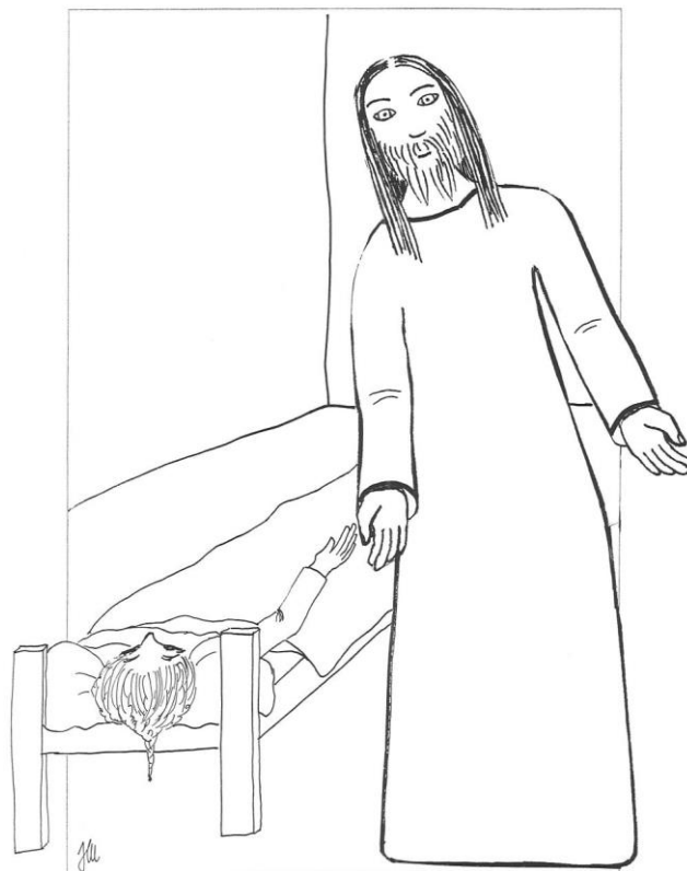
5. neděle v mezidobí cyklu B Mk 1,29-39